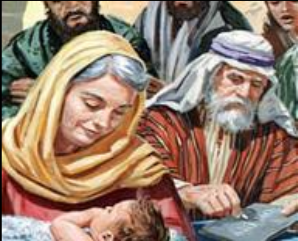
탄생 축일 (6월 24일)