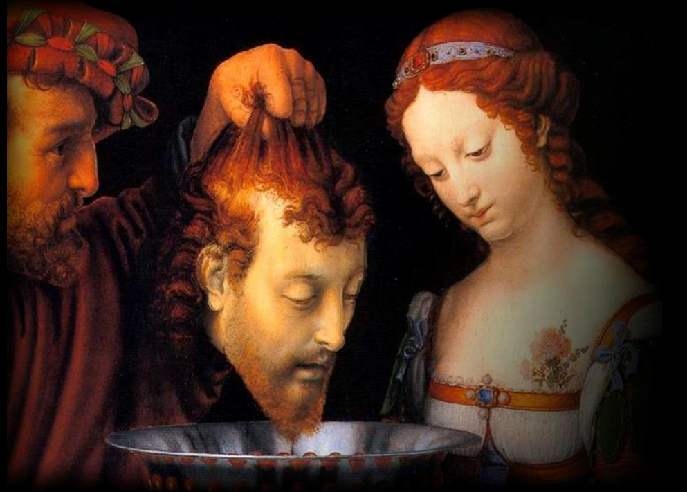
수난 기념일 (8월 29일)